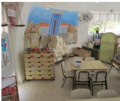
תמונה 2 : חצר הפעילות